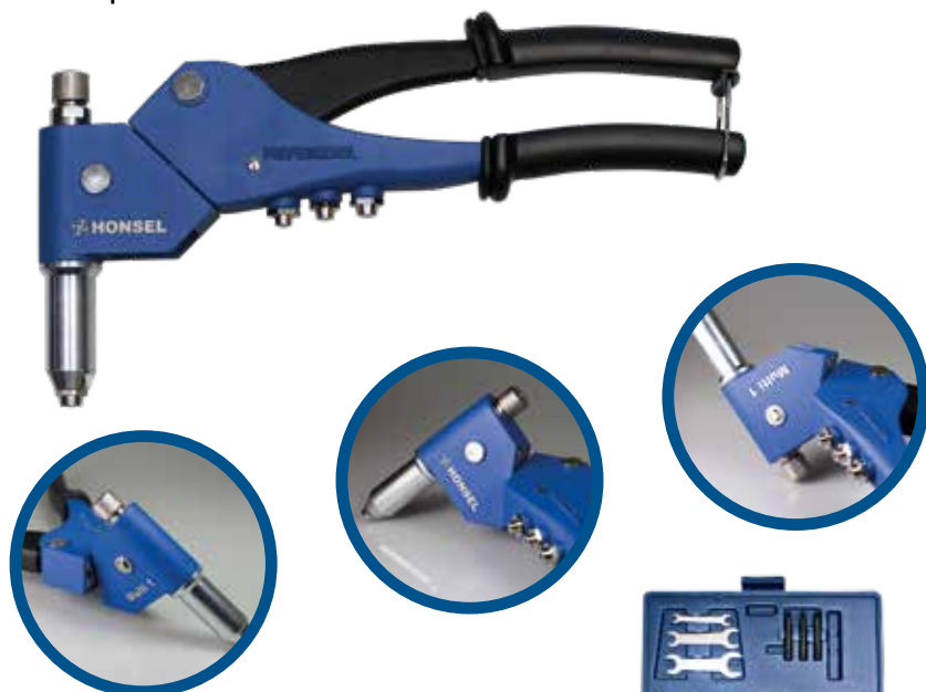
Tête pivotante sur 360°

MULTI 1 dans un coffret en plastique résistant aux chocs.