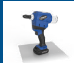
Outillage de pose sur batterie