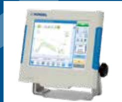
Système de contrôle

Honsel France 20, rue du Lhotaud 25560 Frasné FRANCE