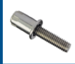
Goujons à sertir en aveugle