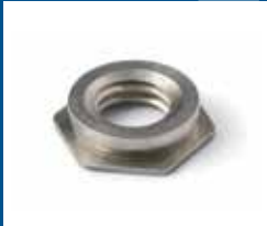
Éléments à sertir à la presse