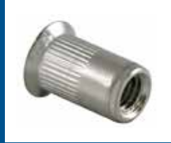
Écrous à sertir en aveugle