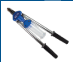
Outillage de pose manuel