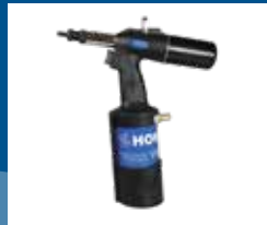
Outillage de pose oléo-pneumatique