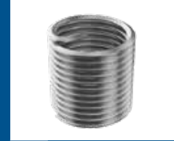
Filets rapportés HONSEL