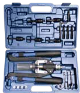
Multi 5 avec bras croisés dans un coffret en plastique résistant aux chocs.